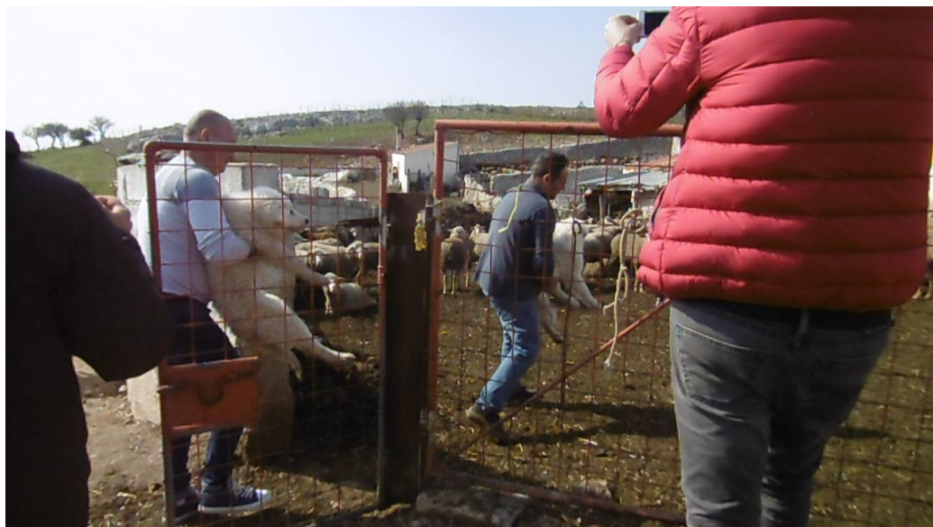
Inserimento nello stazzo

freddybarbarossa98@gmail.com – 3281643184