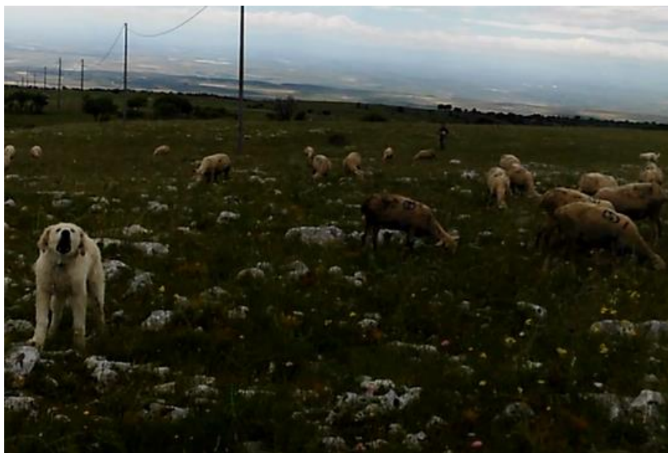
Uno dei cuccioli forniti che difende il gregge