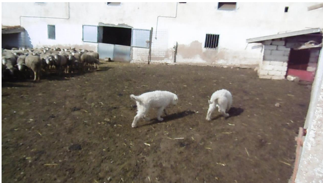
I cuccioli prendono confidenza

Esperto di cani da guardiania, allevamento, imprinting, gestione e monitoraggio.