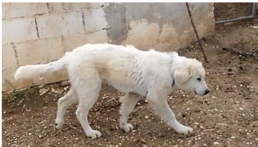
Uno dei cuccioli dati all'azienda Savino, di ottima struttura

Esperto di cani da guardiania, allevamento, imprinting, gestione e monitoraggio.