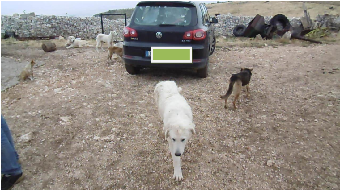
Ancora i cani dell'azienda Savino, in parte meticci, che si aggirano intorno all'abitazione

Esperto di cani da guardiania, allevamento, imprinting, gestione e monitoraggio.