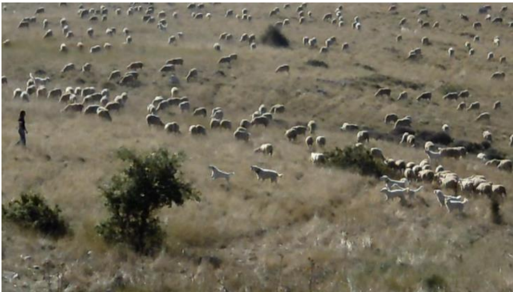
I cani di dell'azienda Savino si radunano per difendere dal pericolo imminente