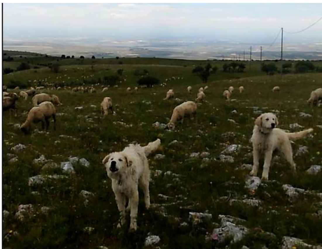
Cuccioli forniti all'azienda Savino che difendono il gregge