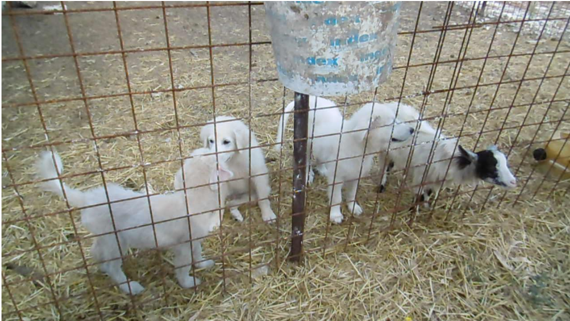
Sono stati rimessi con una capretta

Esperto di cani da guardiania, allevamento, imprinting, gestione e monitoraggio.