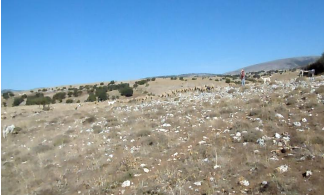
I cani si comportano correttamente durante il pascolo

Esperto di cani da guardiania, allevamento, imprinting, gestione e monitoraggio.