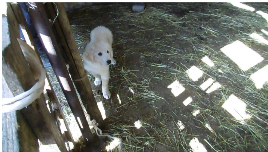
Inserimento in stalla

Esperto di cani da guardiania, allevamento, imprinting, gestione e monitoraggio.