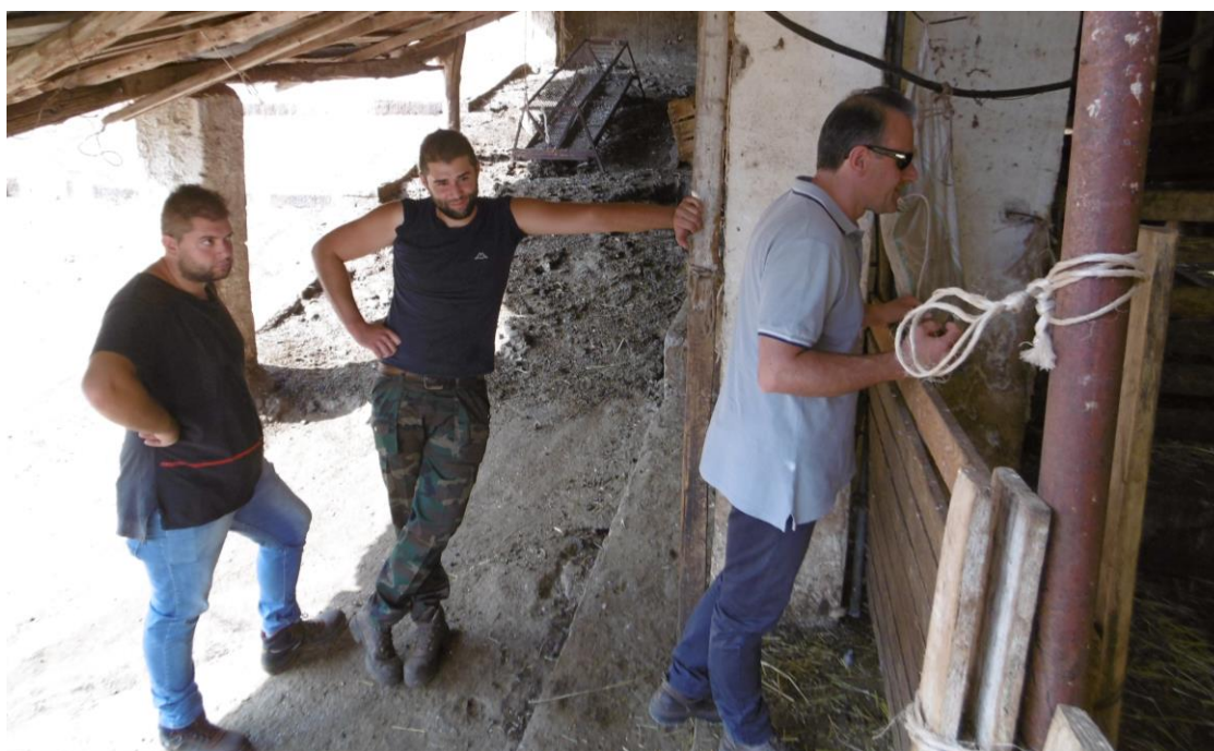
La parte documentale

freddybarbarossa98@gmail.com – 3281643184