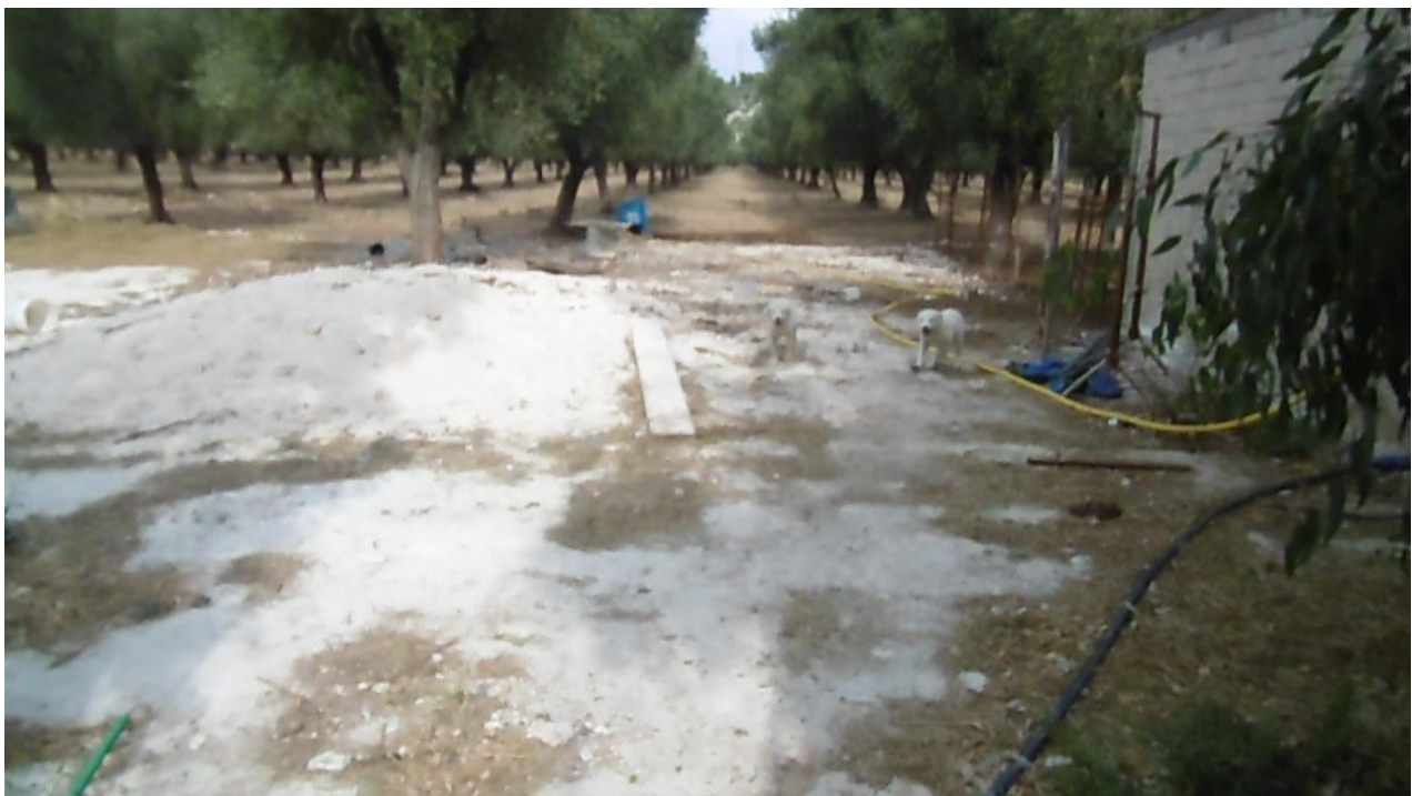
I cuccioli in giro per l'azienda e del gregge neanche l'ombra