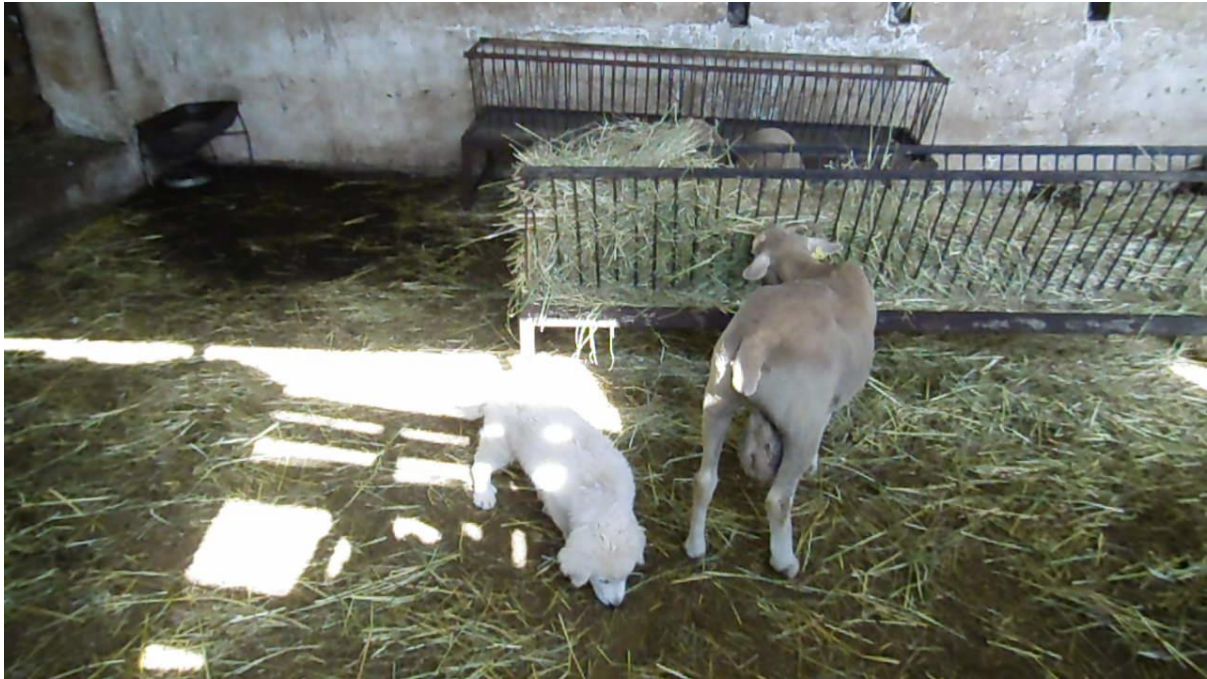
Prima confidenza e ambientazione

Esperto di cani da guardiania, allevamento, imprinting, gestione e monitoraggio.