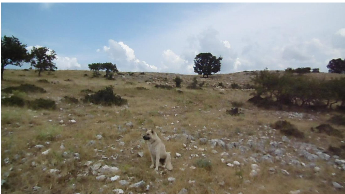
Ancora qualche cane meticcio dell'azienda Savino di cui non si conosce la funzione

freddybarbarossa98@gmail.com – 3281643184